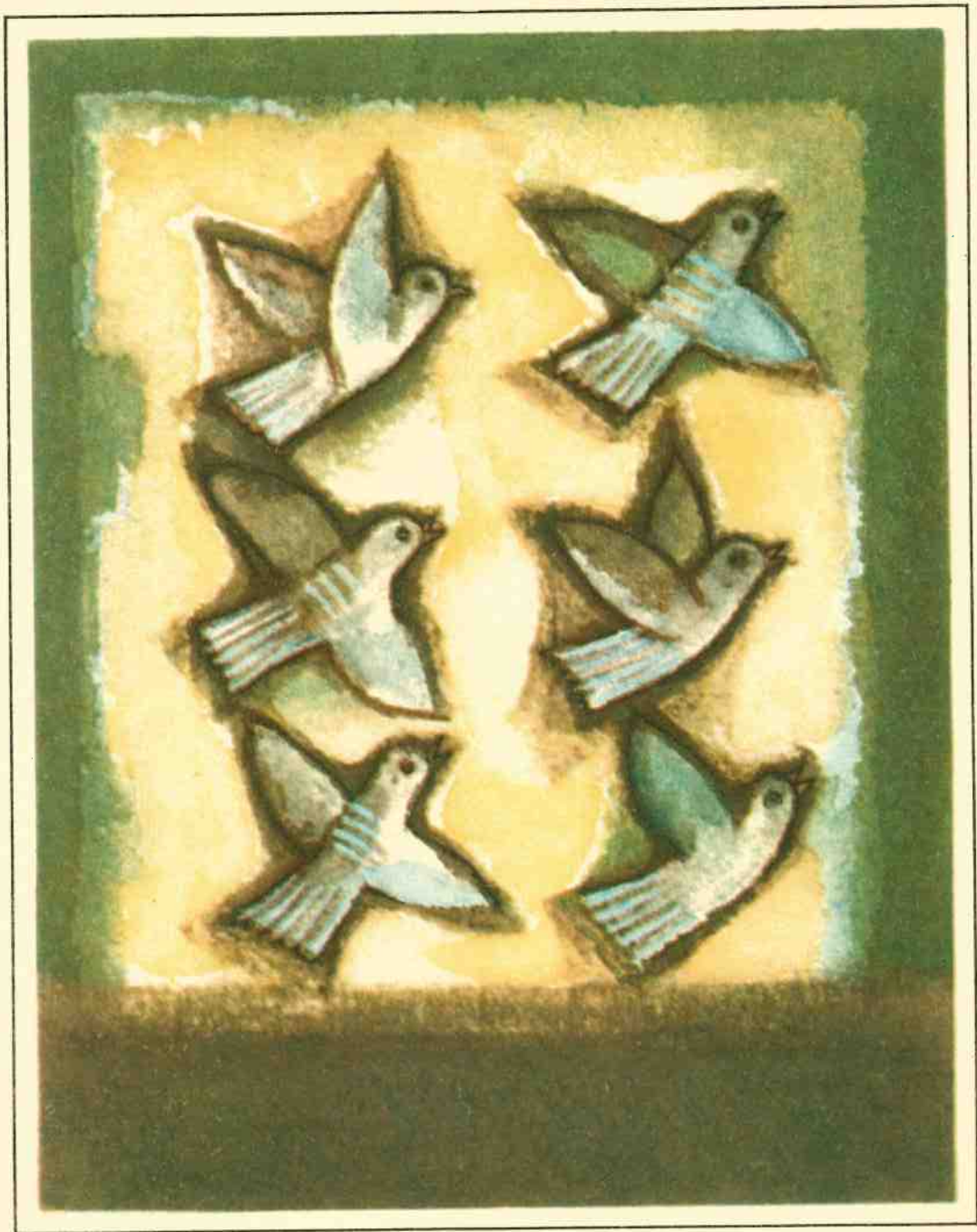
Kaina 13 kp